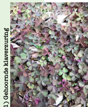
1) Gehoornde klaverzuring