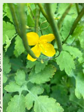
5) Stinkende gouwe