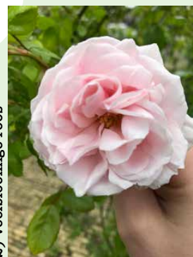
2) Veelbloemige roos